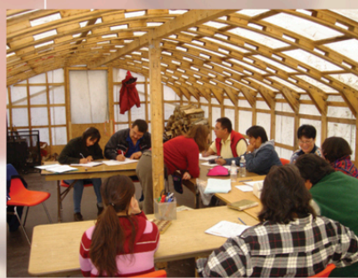
Atelier de création dans le Shaputuan de l'école Amishk à Mashteuiatsh, 2004.