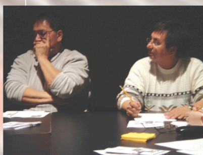
Ma participation à une table ronde portant sur le design autochtone organisé par le projet de recherche Design et culture matérielle : développement communautaire, et cultures autochtones, hiver 2005.