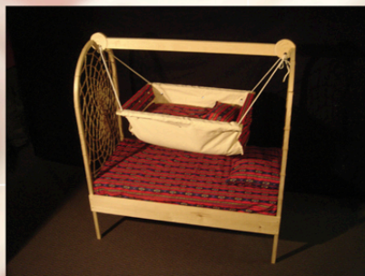
Couchette et berceau inspirés de mon vécu traditionnel lino sous la tente. Frêne, bouleau, cordes de sissal, toile de canevas Denis Blacksmith, 2004.