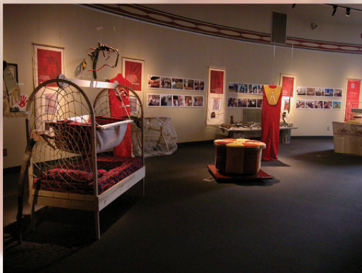
Exposition « La tradition en marche » Musée Amérindien de Mashteuiatsh 2005.