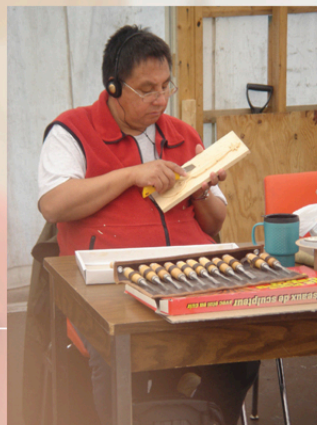
Travail du Logo, atelier Design et culture matérielle, 2004.

Maintenant, je peux mettre en pratique ma créativité qui était comme endormie. Je peux dire que d'avoir participé aux ateliers est la plus belle expérience que j'ai vécue. Elle m'a permis de renouer avec moi-même et avec ma culture. J'espère que le projet aura une continuité, que cela ne s'arrêtera jamais. Cette expérience m'apporte encore plus que je ne le pensais.